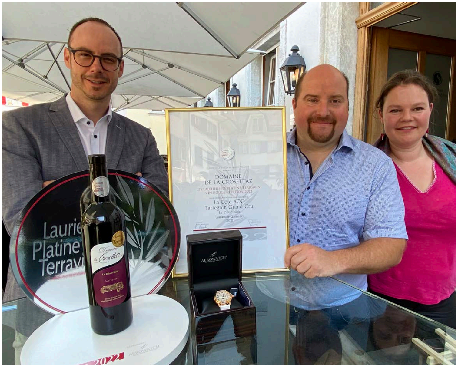
Der 1. Le Désir Noir, La Côte AOC, Tartegnin Grand Cru, Garanoir-Gamaret, 2021 vertreten durch Domaine de La Crosettaz.