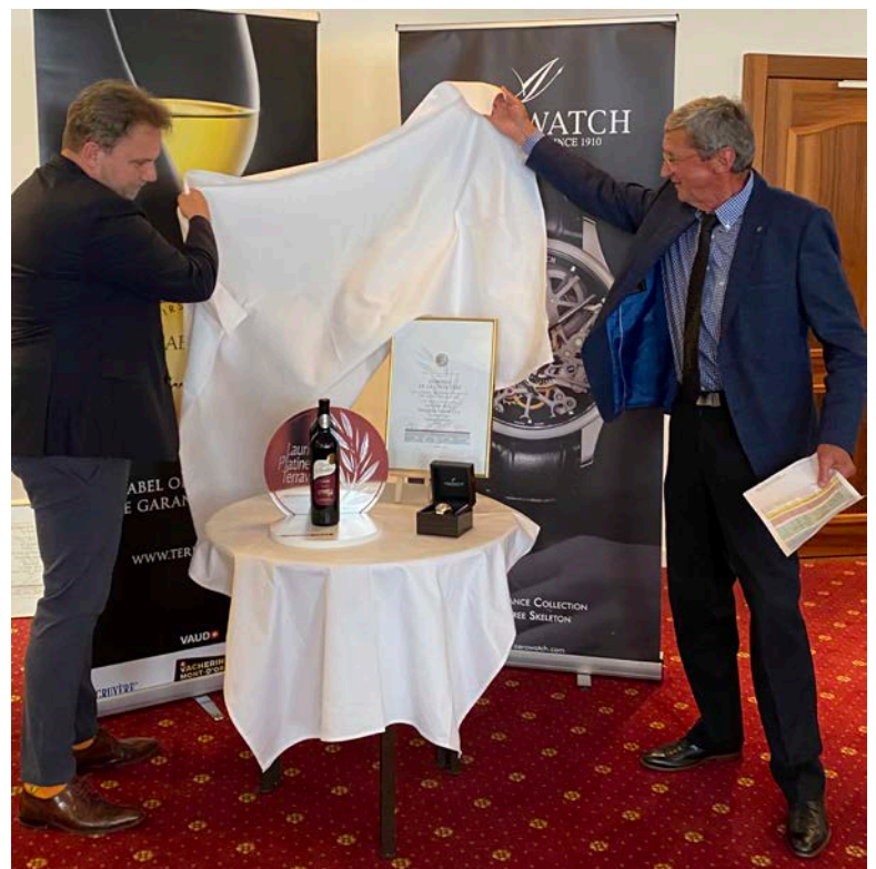
Verleihung Spezialpreise durch Aerowatch